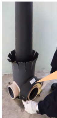
②枝部クボタイカバーを枝管受口にセットします。 50～75用はサイズにより両端を切り落として使用します。