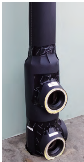
2 段枝モデルのセット状態