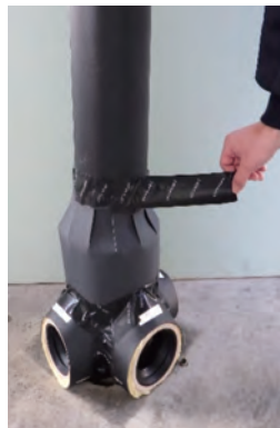
③遮音シート専用固定テープ(別売)を用いて上部 クボタイカバーと枝部クボタイカバーを固定します。

【ご注意】 施工方法の詳細については製品に梱包の「上部・枝部クボタイカバー取扱説明書」をご確認ください。