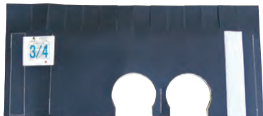
上部クボタイカバー

「上部クボタイカバー」及び「枝部クボタイカバー」は、「カンペイ君」または「カンペイ立て管」が「カンペイシート」と併用される場合の集合管上部用遮音シートです。(国交大臣認定・消防性能評定取得品)