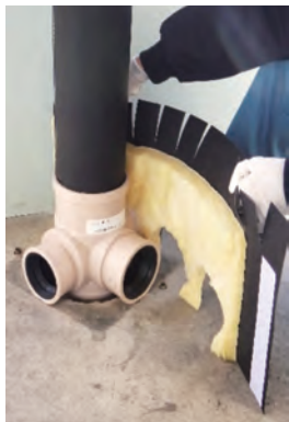
①上部クボタイカバーを 集合管上部にセットします。