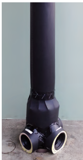
1 段枝モデルのセット状態