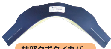
枝部クボタイカバー